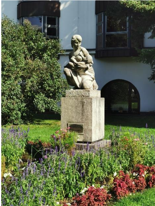
Socha Mateřská láska