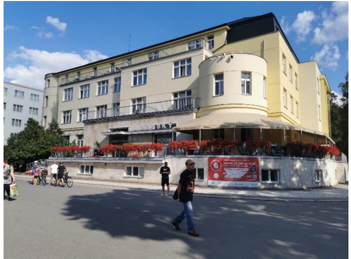
Lázeňský hotel Libenský